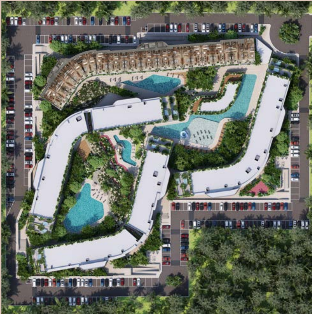
Planta Baja / Ground Floor