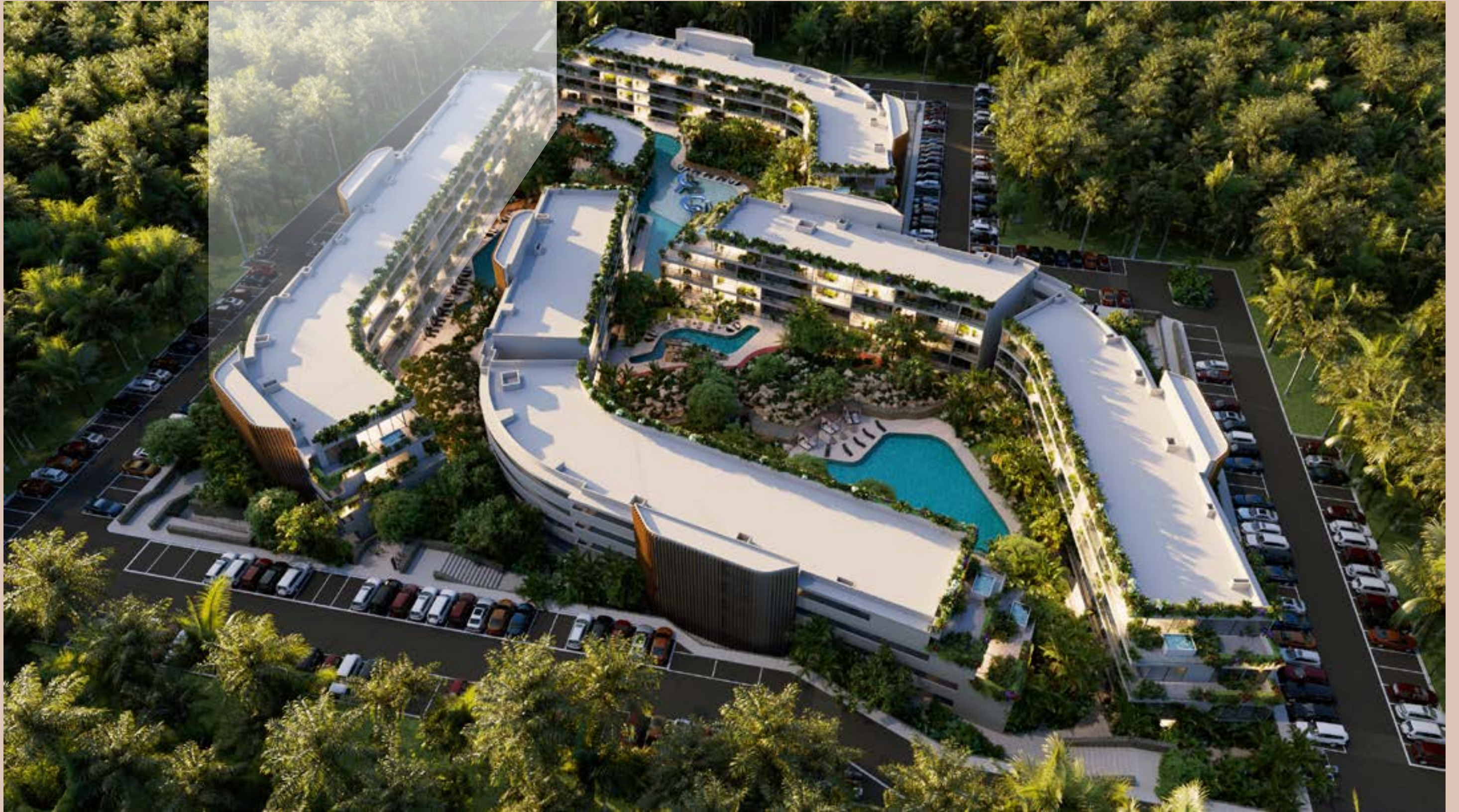
TORRE D TOWER